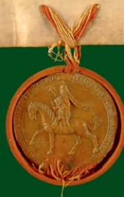
Foto: Stadtarchiv Zwickau, erste urkundliche Erwähnung vom „Hohen Forst“ (1316)